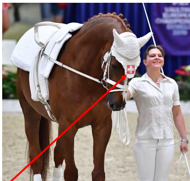
Hier könnte Ihr Logo auf dem Ohrgarn ersichtlich sein.