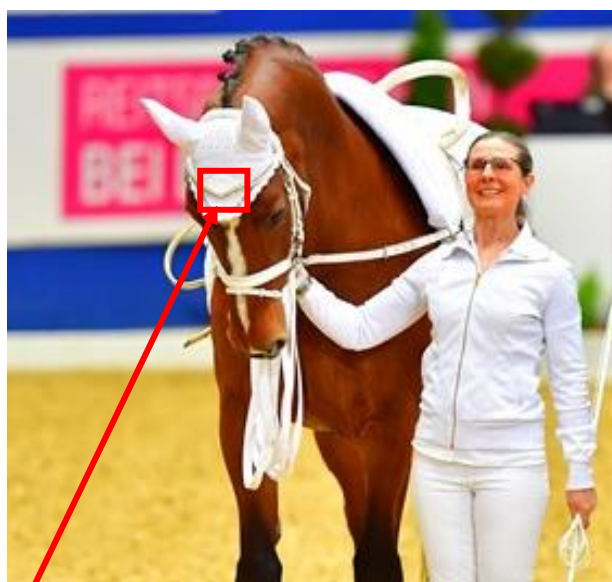
Hier könnte Ihr Logo auf dem Ohrgarn ersichtlich sein.